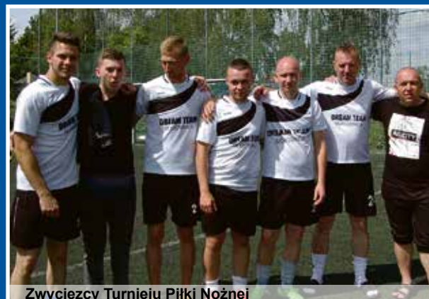
Zwycięzcy Turnieju Piłki Nożnej