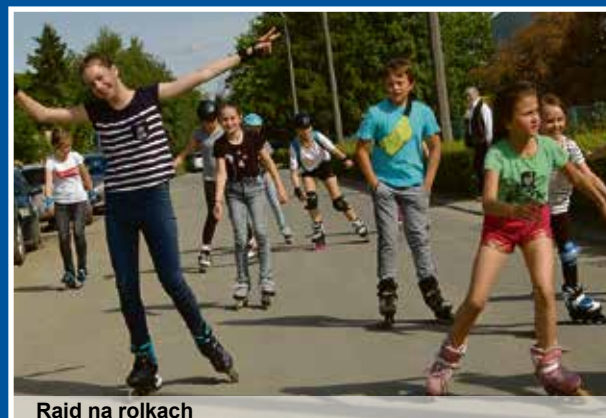
Rajd na rolkach