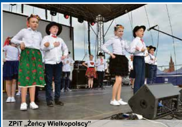
ZPiT „Żeńcy Wielkopolscy”