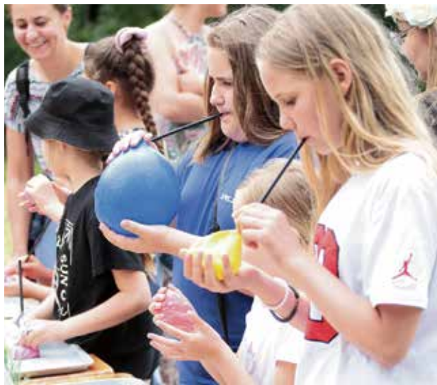
Dzień Dziecka na sportowo na śmigiejskim stadionie i Orliku obchodzili uczniowie ze szkoły w Czaczu.